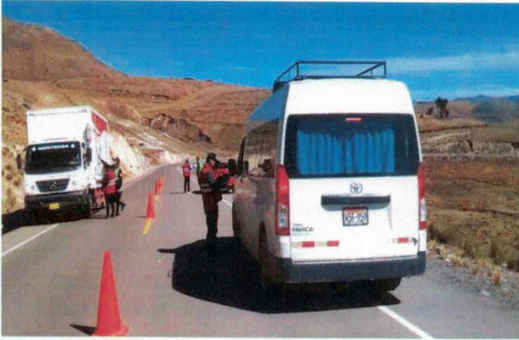
FISCALIZACIÓN AL SERVICIO DE TRANSPORTE TERRESTRE DE PERSONAS