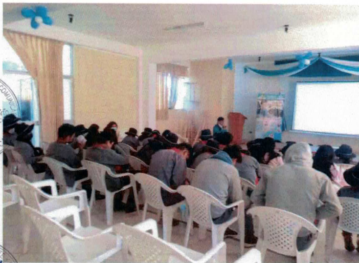
CAPACITACIÓN A USUARIOS DE LAS VÍAS EN TEMAS DE EDUCACIÓN EN SEGURIDAD VIAL