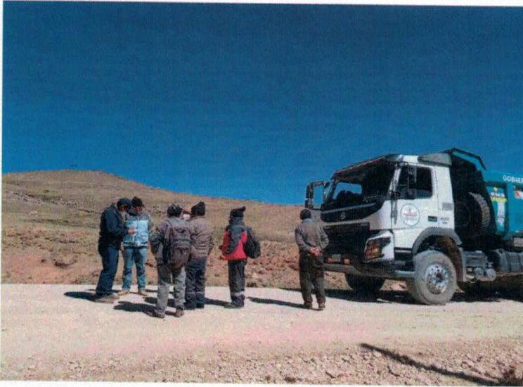
SUPERVISIÓN A LOS TRABAJOS REALIZADOS EN EL MANTENIMIENTO DEL TRAMO HV-111