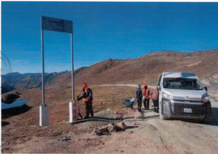
MONITOREO DE LA ACTIVIDAD REALIZADA EN LA CARRETERA HV-109 SECTOR LLULLUCHACCASA – HUARI.