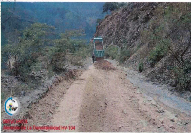
ATENCIÓN DE LA TRANSITABILIDAD POR EMERGENCIAS DE LA INFRAESTRUCTURA VIAL HV- 104, TRAYECTORIA: EMP. PE-3SD (CHONTA) - SAN PEDRO DE CORIS - DV. COBRIZA