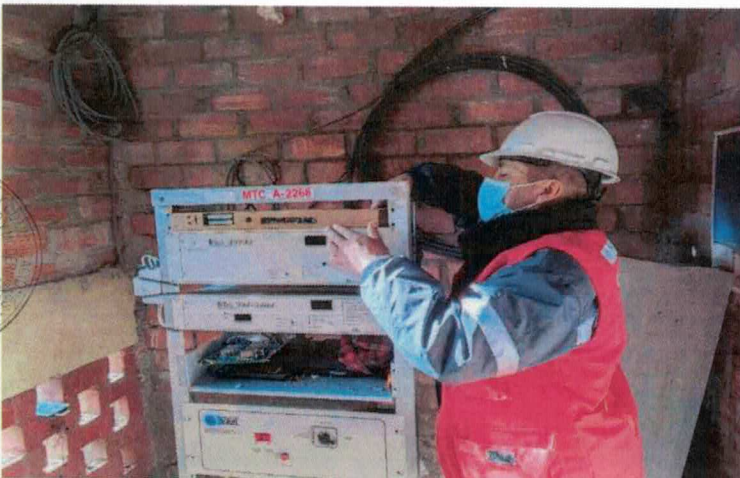
MANTENIMIENTO DE TRANSMISOR DE TV Y RADIO