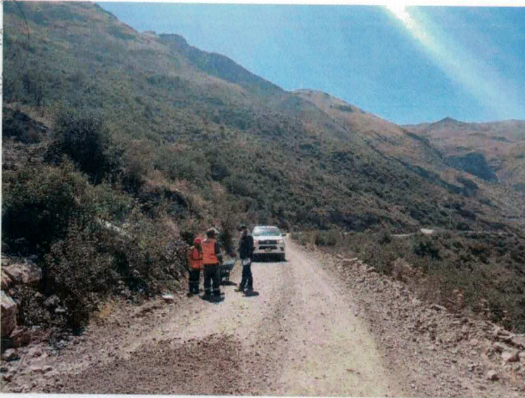
SUPERVISIÓN A LOS TRABAJOS REALIZADOS EN EL MANTENIMIENTO DEL TRAMO HV-111