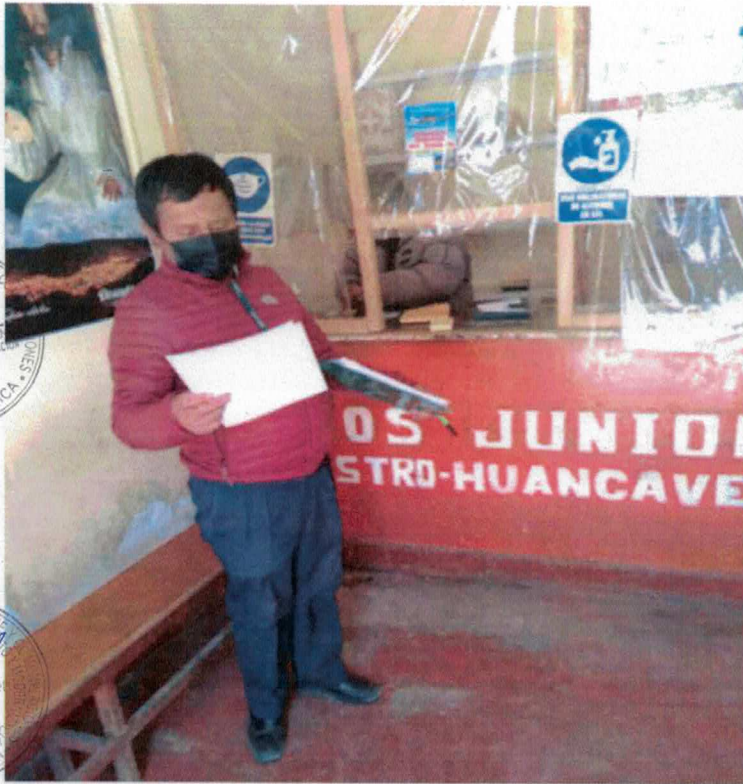
FISCALIZACIÓN A LAS ENTIDADES DE INFRAESTRUCTURA COMPLEMENTARIA