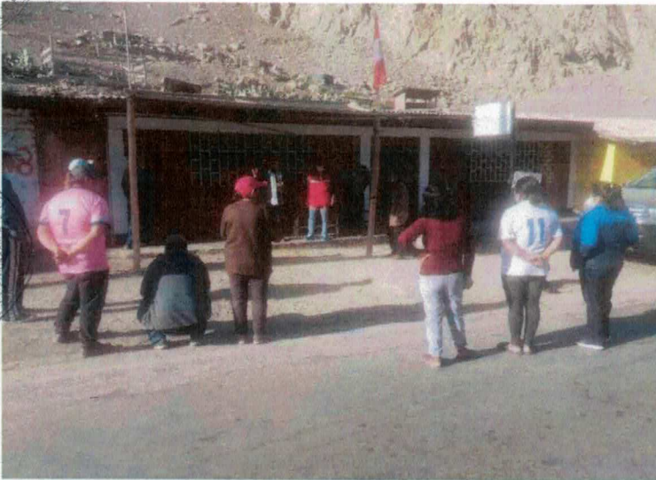
DIFUSIÓN DE INFORMACION RESPECTO A LOS SERVICIOS DE TELECOMUNICACIONES.