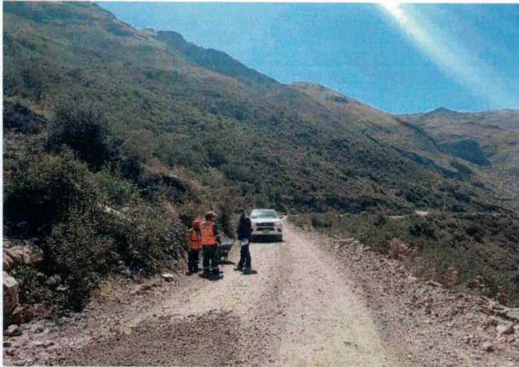
MONITOREO DE LA ACTIVIDAD "MANTENIMIENTO RUTINARIO DE LA RED VIAL DEPARTAMENTAL NO PAVIMENTADA HV-111"