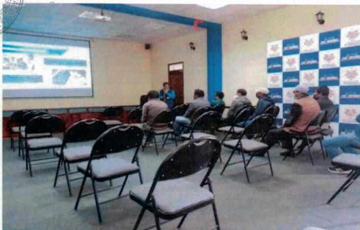
CAPACITACIÓN EN SEGURIDAD VIAL A CONDUCTORES INFRACTORES