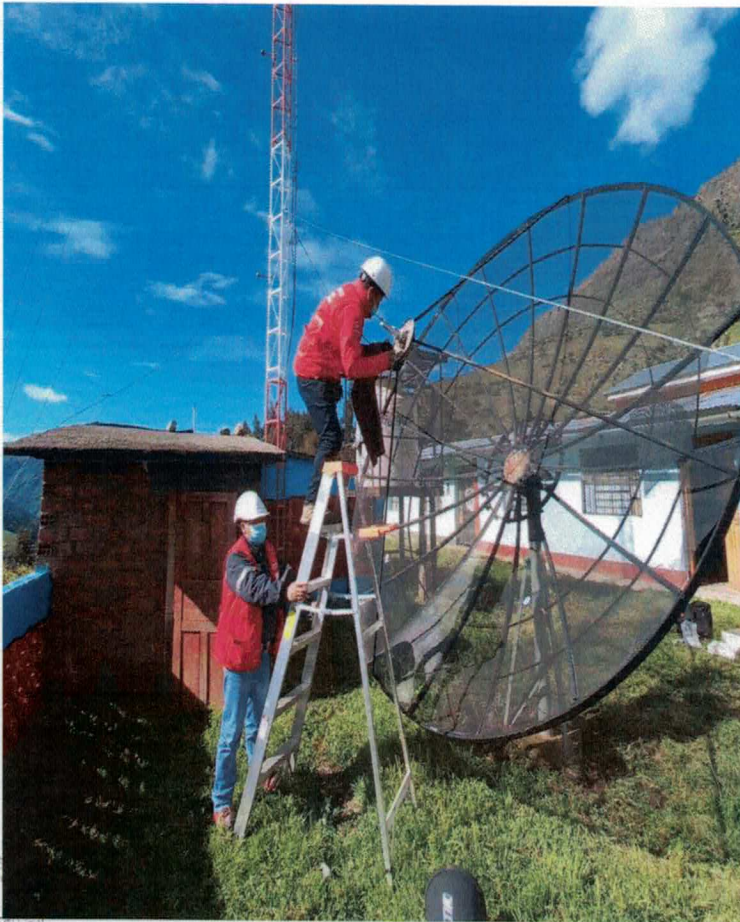
CAMBIO DE MALLAS DE ANTENA PARABOLICA Y MANTENIMIENTO DE ANTENA PARABOLICA.