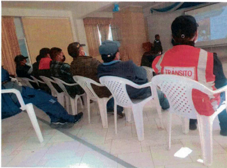
CAPACITACIÓN A ESPECIALISTAS EN TEMAS DE SEGURIDAD VIAL