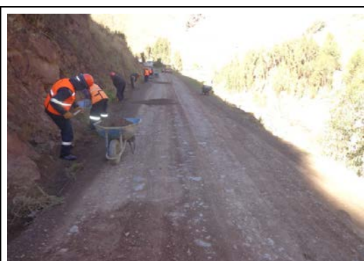
LIMPIEZA DE CUNETAS