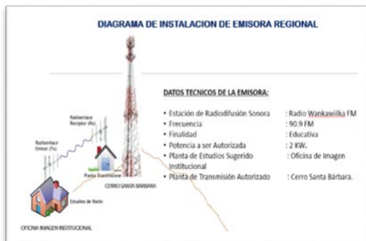
DIAGRAMA DE INSTALACION DE EMISORA REGIONAL