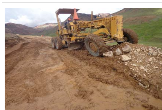
DESENCALAMINADO DE PLATAFORMA