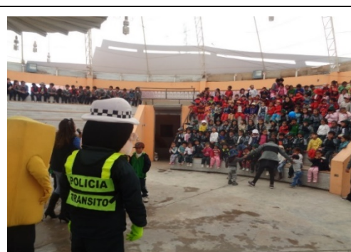
CAPACITACION A ESTUDIANTES – PROVINCIA DE TAYACAJA