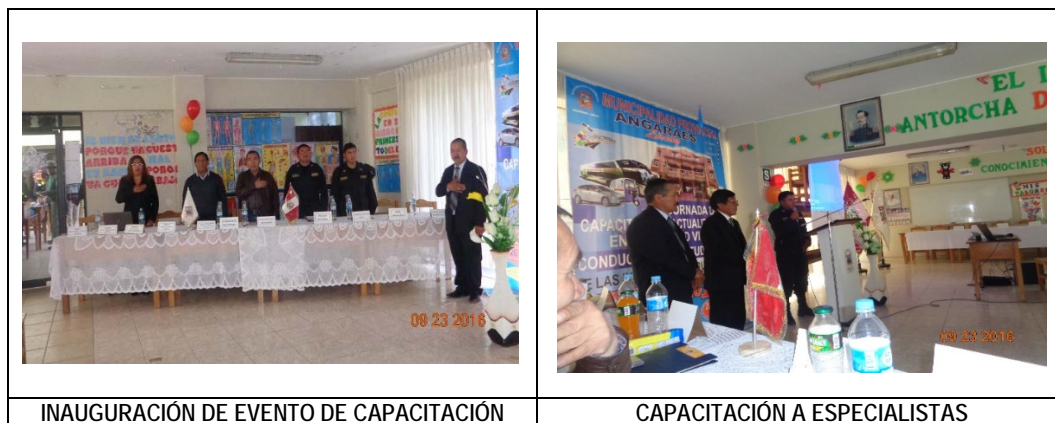
INAUGURACIÓN DE EVENTO DE CAPACITACIÓN