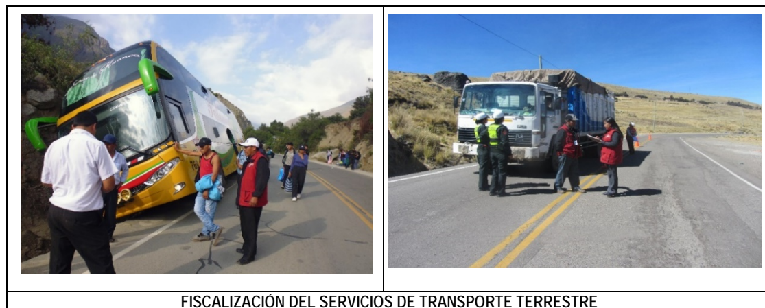
FISCALIZACIÓN DEL SERVICIOS DE TRANSPORTE TERRESTRE