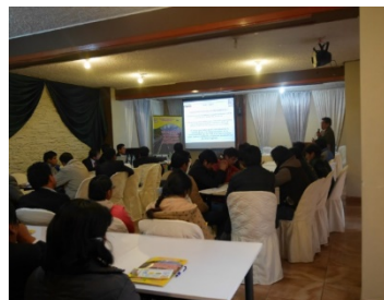
REUNIÓN PARTICIPATIVA PARA LA ACTUALIZACIÓN DEL PLAN VIAL REGIONAL