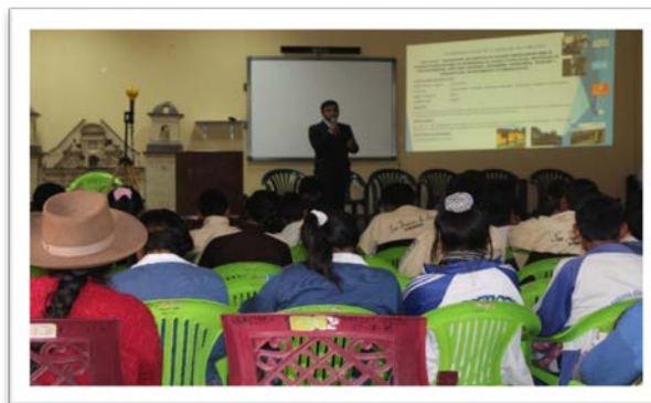
REALIZACION DE FOROS SOBRE LAS ANTENAS Y LOS EFECTOS EN LA SALUD

Se realizó capacitaciones sobre Radiaciones no Ionizantes y los efectos en la salud de la población, donde se informaron que las radiaciones emitidas por las antenas no causan CANCER y son indispensables para que las telecomunicaciones se desarrollen. Estas capacitaciones fueron dirigidas a los estudiantes de las Instituciones Educativas de nivel primario, secundario, superior, autoridades y público en general de las 07 provincias