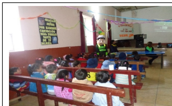
CAPACITACION A ESCOLARES DEL NIVEL PRIMARIA