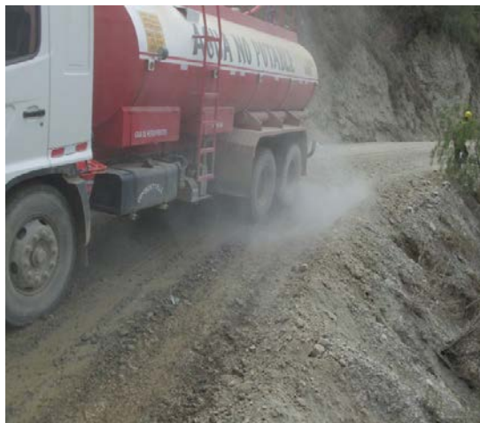
PROCESO DE REGADO DE LA PLATAFORMA