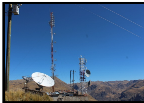
PLANTA DE TRANSMISION DE EMISORA REGIONAL ESTARA EN CERRO SANTA BARBARA