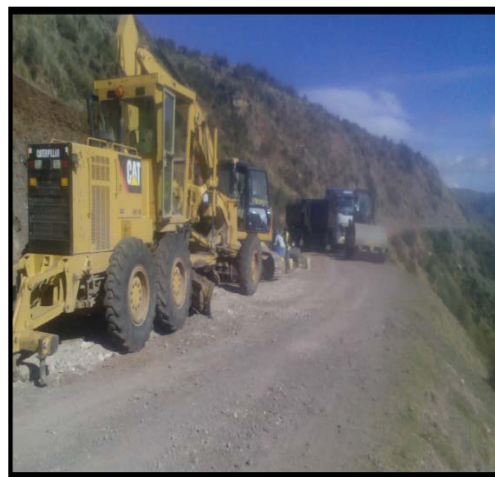
PROCESO DE PERFILACION DE PLATAFORMA.